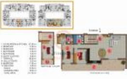
(3+1) COLUMN 17 (Dünya 130)