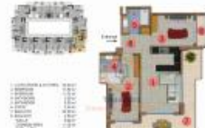
(2+1) COLUMN 3 (1123323435363738394041)