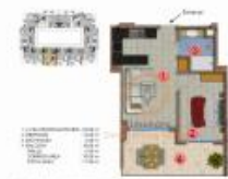
(1+1) COLUMN 6 (112635363738394041)