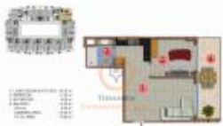
(1+1) COLUMN 1 (11213036373839404142)