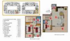
(3+1) COLUMN 16 (Dünya 130)