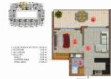
(3+1) COLUMN 11 (11314041)