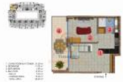
(1+1) COLUMN 10 (1130394041)