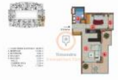
(1+1) COLUMN 14 (1134)