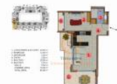
(1+1) COLUMN 8 (11283738394041)