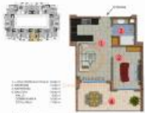
(1+1) COLUMN 5 (11253435363738394041)