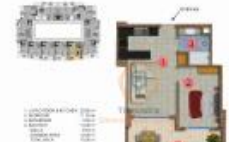
(1+1) COLUMN 4 (1124333435363738394041)