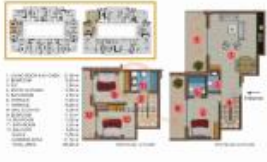
(3+1) COLUMN 19 (Dünya 130)