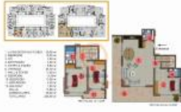
(3+1) COLUMN 18 (Dünya 130)