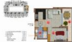
(1+1) COLUMN 2 (1122313435363738394041)