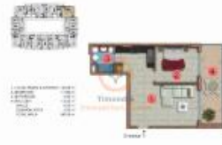
(1+1) COLUMN 13 (113342)