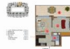
(1+1) COLUMN 12 (113241)