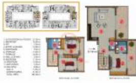
(3+1) COLUMN 15 (Dünya 130)