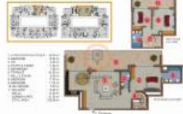
(3+1) COLUMN 20 (Dünya 141)