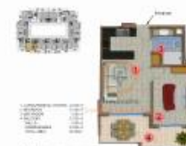
(1+1) COLUMN 7 (1127363738394041)